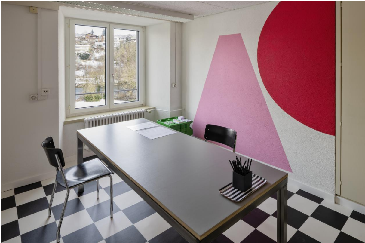
Spinnerei Turgi Innenansicht Musterbüro