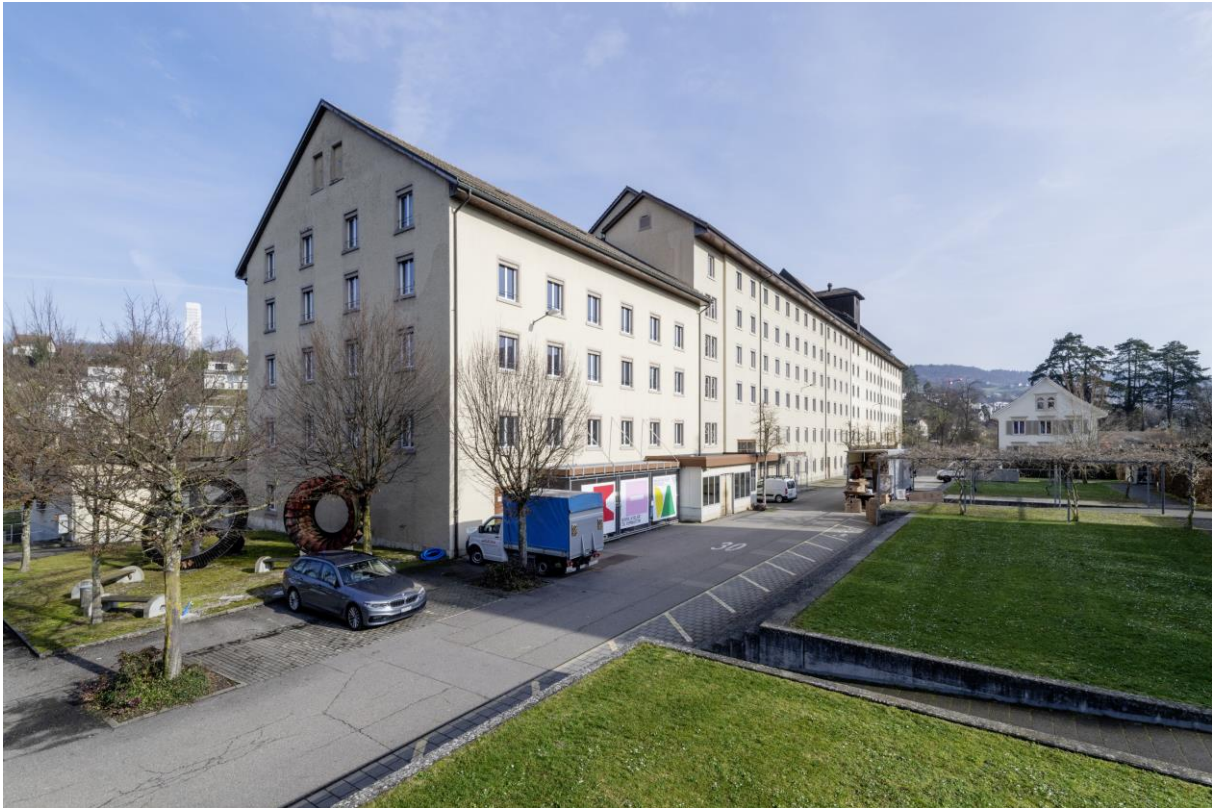
Spinnerei Turgi Ansicht Süd-West