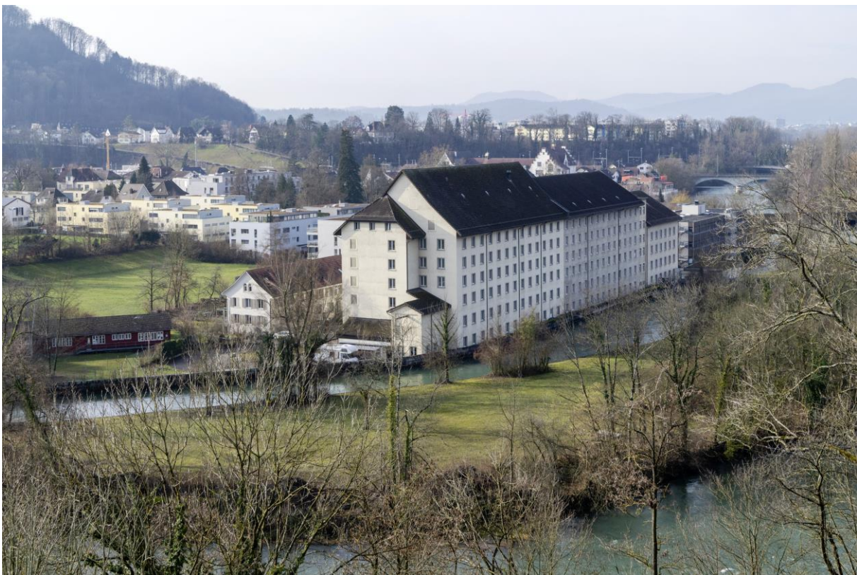
Spinnerei Turgi Ansicht Nord-Ost