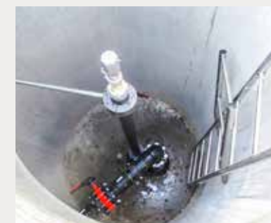
Contracting, Heizanlage mit Grundwasserwärmepumpe und Ölzusatzheizung für die Gemeinde Koblenz

Die Gemeinschaft stand vor der Frage, wie weiter mit der Heizanlage. Die eine Häuserzeile beherbergte die Heizung, die andere Zeile den Öltank. Die RWB begleitete die STOWEG bei der Entscheidungsfindung und realisierte für jede Häuserzeile mit je acht Häusern eine unabhängige Wärmepumpenanlage für Heizung und Warmwasser «schlüsselfertig zum Fixpreis».