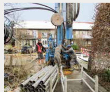
Wärmepumpe mit Erdwärmesonden für eine Eigentümergeinschaft in Rüthhof Baden

Im Auftrag der Eigentümergemeinschaft Steinstrasse 32–40 in Rüthhof wurde eine Photovoltaikanlage erstellt. Der produzierte Strom wird so weit wie möglich direkt vor Ort im Rahmen der Eigenverbrauchsgemeinschaft genutzt. Die Dienstleistungen der RWB umfassen nebst dem Bau der Anlage als GU das nötige Vertragswerk sowie die Abrechnung zwischen den Eigenverbrauchern.