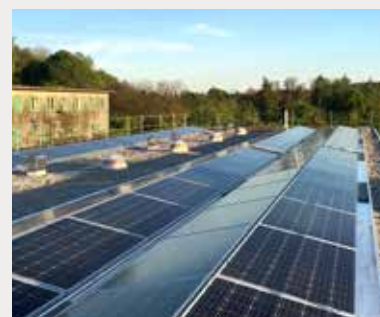
Eigenverbrauchsgemeinschaft Photovoltaikanlage in Rüthhof Baden

Im Auftrag der Eigentümergemeinschaft Steinstrasse 32–40 in Rüthhof wurde eine Photovoltaikanlage erstellt. Der produzierte Strom wird so weit wie möglich direkt vor Ort im Rahmen der Eigenverbrauchsgemeinschaft genutzt. Die Dienstleistungen der RWB umfassen nebst dem Bau der Anlage als GU das nötige Vertragswerk sowie die Abrechnung zwischen den Eigenverbrauchern.