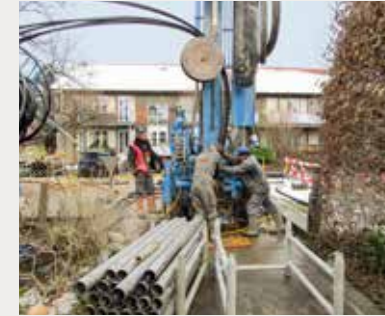
Wärmepumpe mit Erdwärmesonden für eine Eigentümergeinschaft in Rütihof Baden

Im Auftrag der Eigentümergemeinschaft Steinstrasse 32–40 in Rütihof wurde eine Photovoltaikanlage erstellt. Der produzierte Strom wird so weit wie möglich direkt vor Ort im Rahmen der Eigenverbrauchsgemeinschaft genutzt. Die Dienstleistungen der RWB umfassen nebst dem Bau der Anlage als GU das nötige Vertragswerk sowie die Abrechnung zwischen den Eigenverbrauchern.