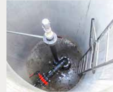
Contracting, Heizanlage mit Grundwasserwärmepumpe und Ölzusatzheizung für die Gemeinde Koblenz

Die Gemeinschaft stand vor der Frage, wie weiter mit der Heizanlage. Die eine Häuserzeile beherbergte die Heizung, die andere Zeile den Öltank. Die RWB begleitete die STOWEG bei der Entscheidungsfindung und realisierte für jede Häuserzeile mit je acht Häusern eine unabhängige Wärmepumpenanlage für Heizung und Warmwasser «schlüsselfertig zum Fixpreis».