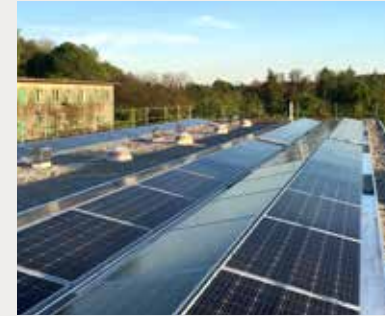
Eigenverbrauchsgemeinschaft Photovoltaikanlage in Rütihof Baden

Im Auftrag der Eigentümergemeinschaft Steinstrasse 32–40 in Rütihof wurde eine Photovoltaikanlage erstellt. Der produzierte Strom wird so weit wie möglich direkt vor Ort im Rahmen der Eigenverbrauchsgemeinschaft genutzt. Die Dienstleistungen der RWB umfassen nebst dem Bau der Anlage als GU das nötige Vertragswerk sowie die Abrechnung zwischen den Eigenverbrauchern.